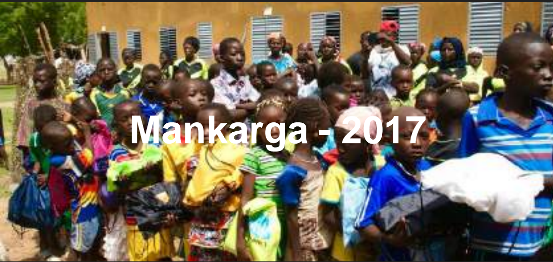
Mankarga - 2017