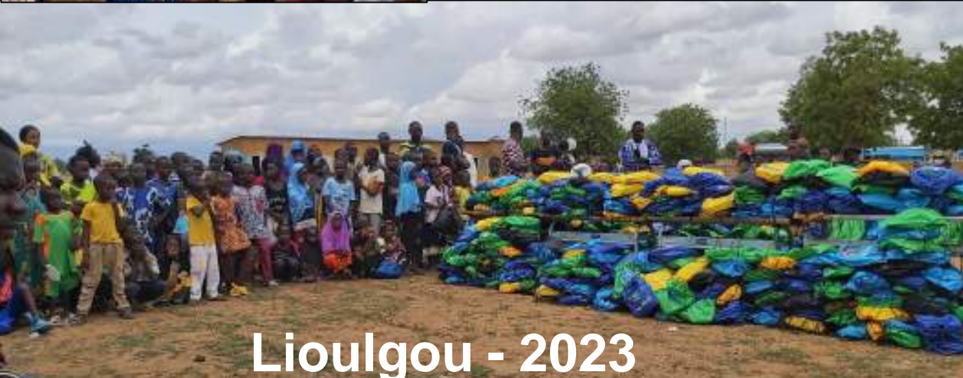
Lioulgou - 2023