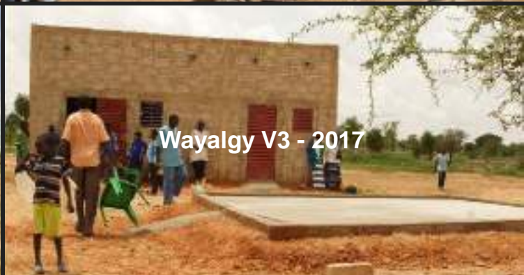
Wayalgy V3 - 2017