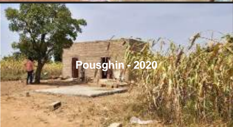
Pousghin - 2020