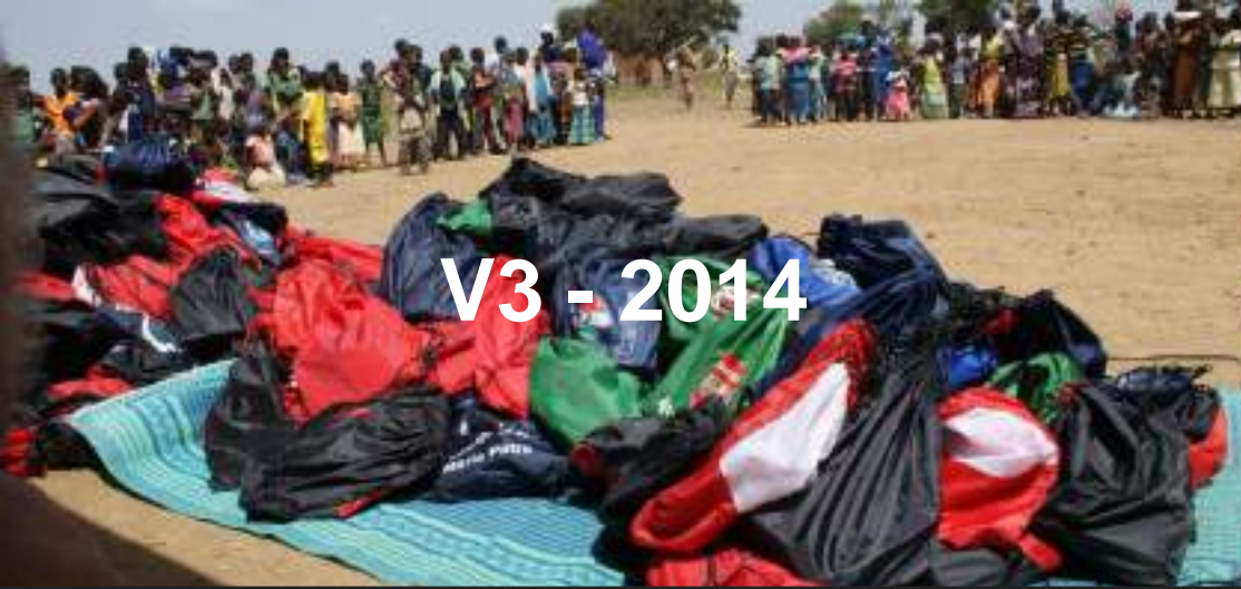
V3 - 2014