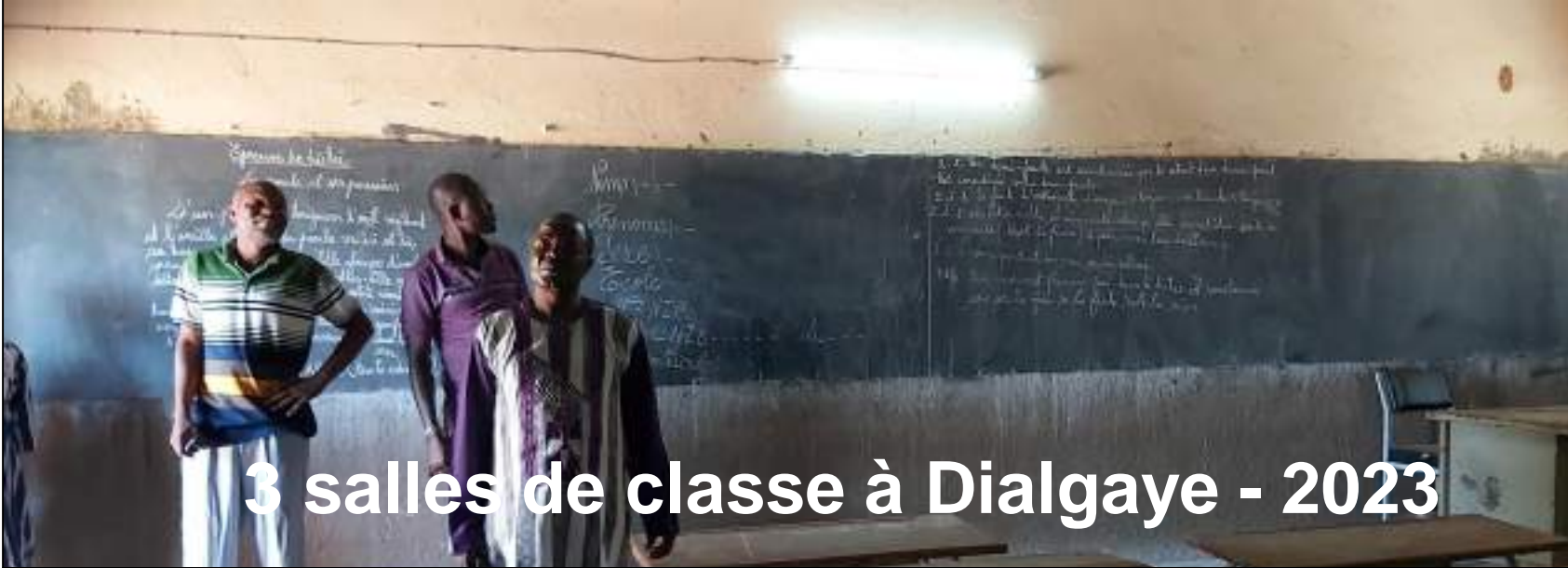
3 salles de classe à Dialgaye - 2023