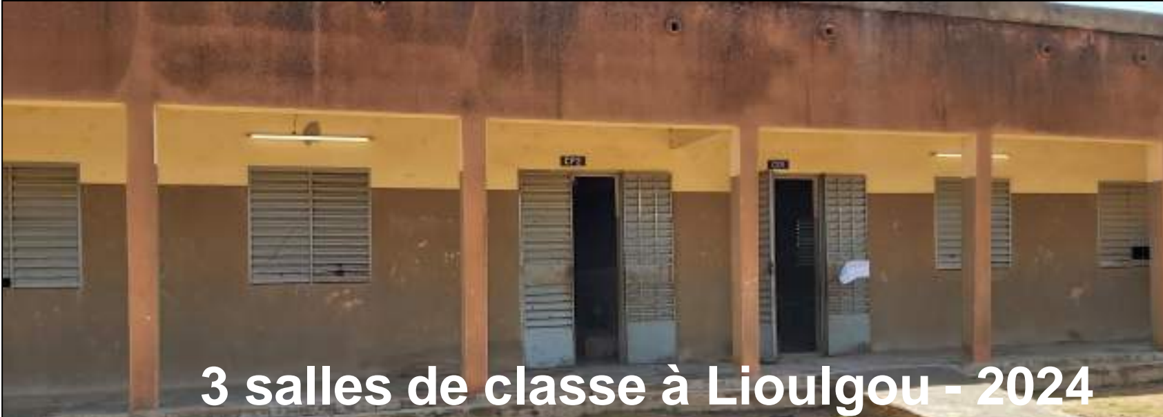
3 salles de classe à Lioulgou - 2024

18 salles de classes électrifiées = 13 000 €