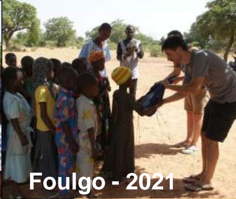
Foulgo - 2021