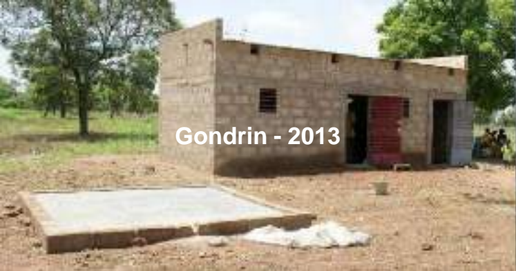
Gondrin - 2013