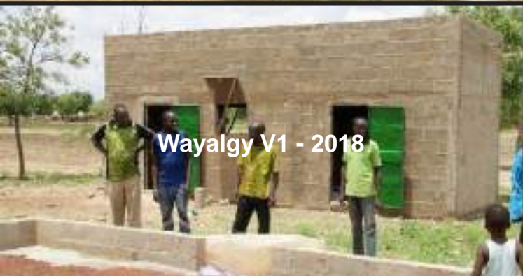
Wayalgy V1 - 2018