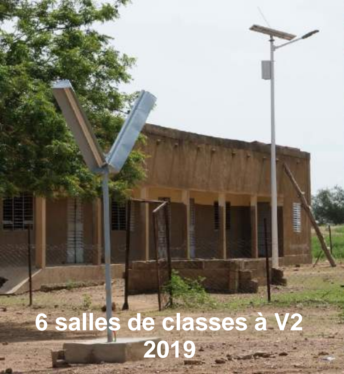
6 salles de classes à V2 2019