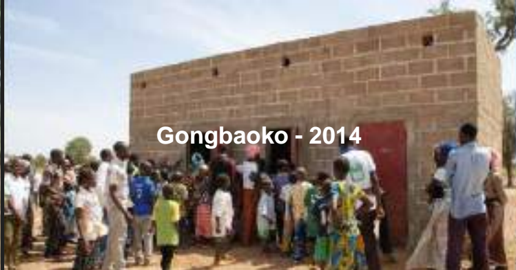
Gongbaoko - 2014