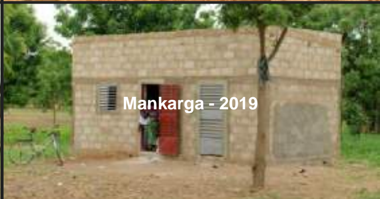
Mankarga - 2019