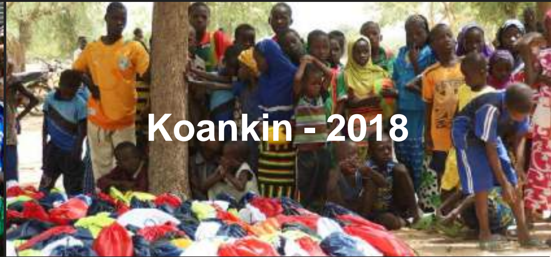
Koankin - 2018