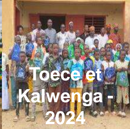
Toece et Kalwenga - 2024