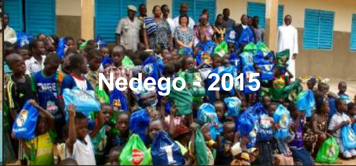
Nedego - 2015