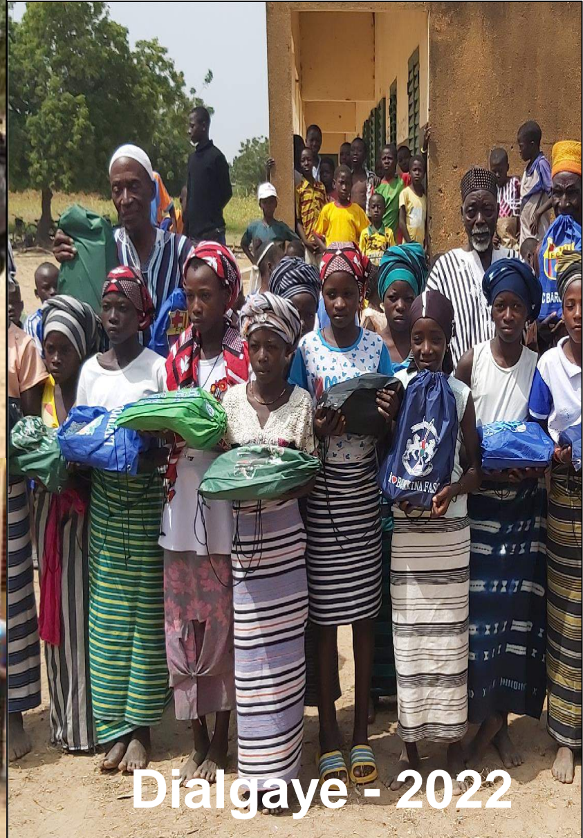
Dialgaye - 2022