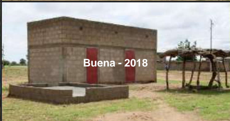
Buena - 2018