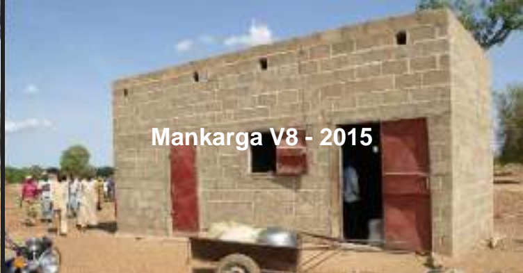
Mankarga V8 - 2015