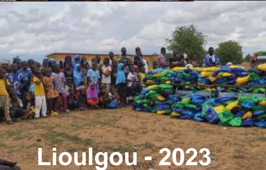
Lioulgou - 2023