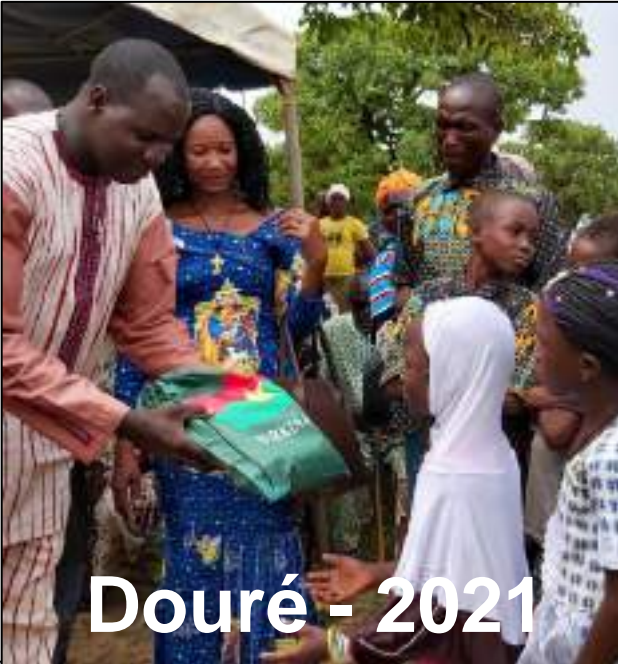
Douré - 2021