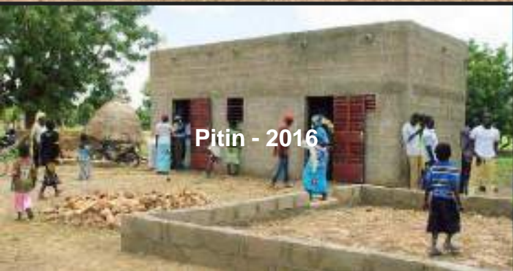
Pitin - 2016