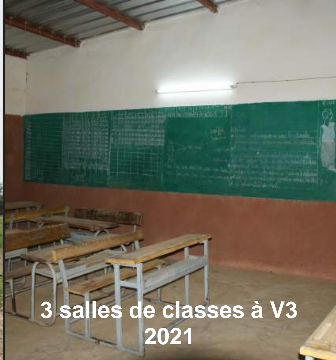
3 salles de classes à V3 2021