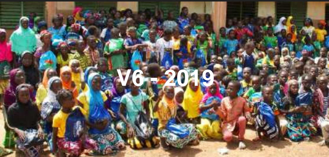
V6 - 2019