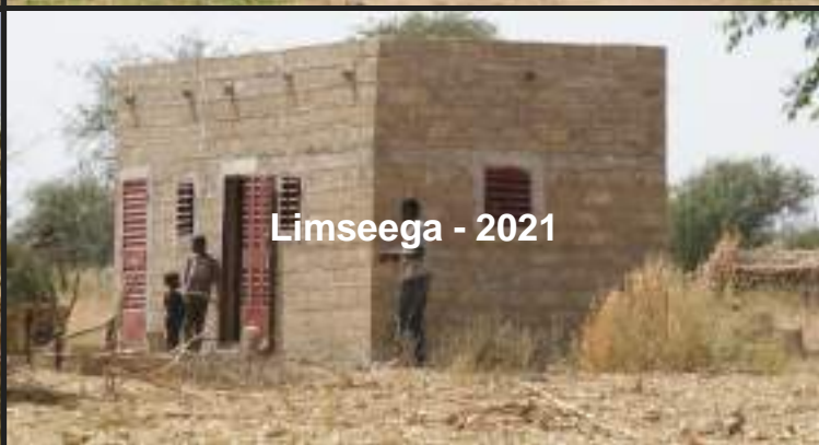
Limseega - 2021